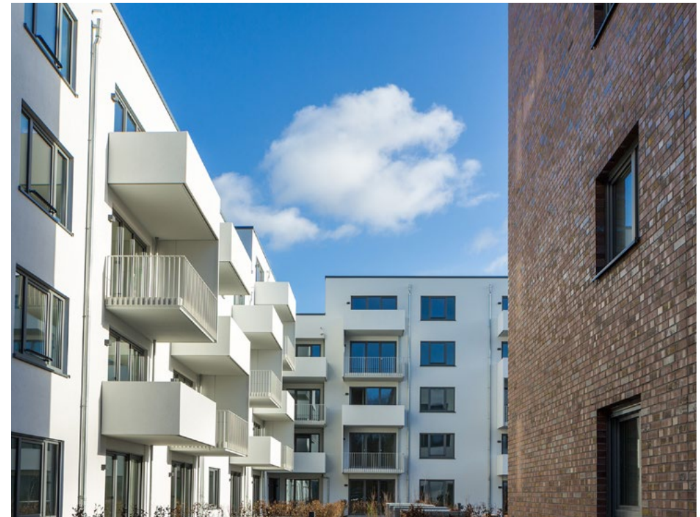
Modernes Wohndesign direkt am Stadtpark.