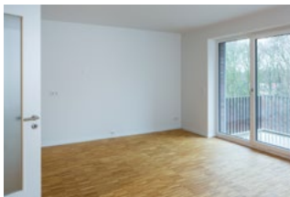
Platz für individuelle Ideen