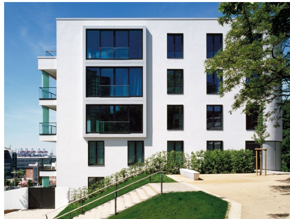
Exklusive Lage direkt am Elbhang.