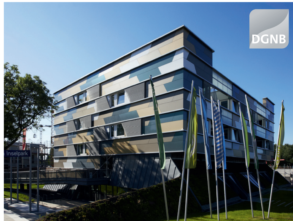
Das Bürohaus der umweltfreundlichen Zukunft.