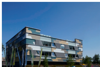
In der „Mitte Wilhelmsburg“

Mit dem durch die Deutsche Gesellschaft für Nachhaltiges Bauen (DGNB) e.V. mit Silber prämierten Green Building setzt Wilhelmsburg ein deutliches Zeichen: Hier beginnt die Zukunft!