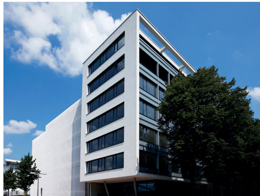
Energiesparende Büroräume für kreative Ideen.