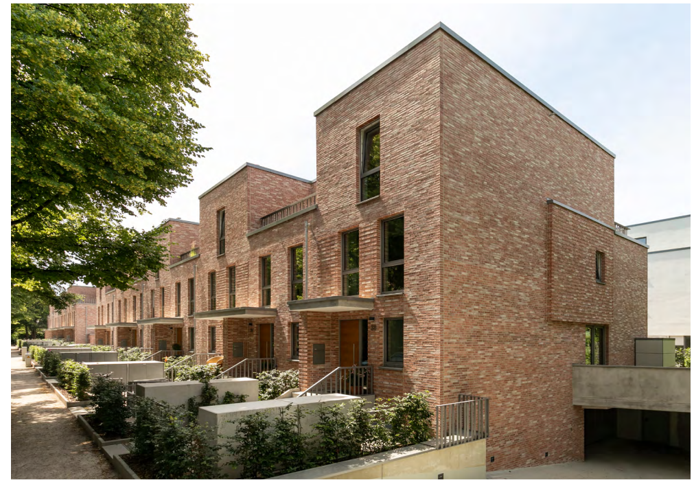
Moderne Architektur umgeben von viel Grün und altem Baumbestand