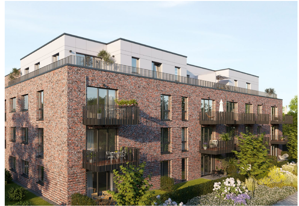
Echt plietsch: Die zeitlose Architektur mit ihrer typischen Klinkerfassade