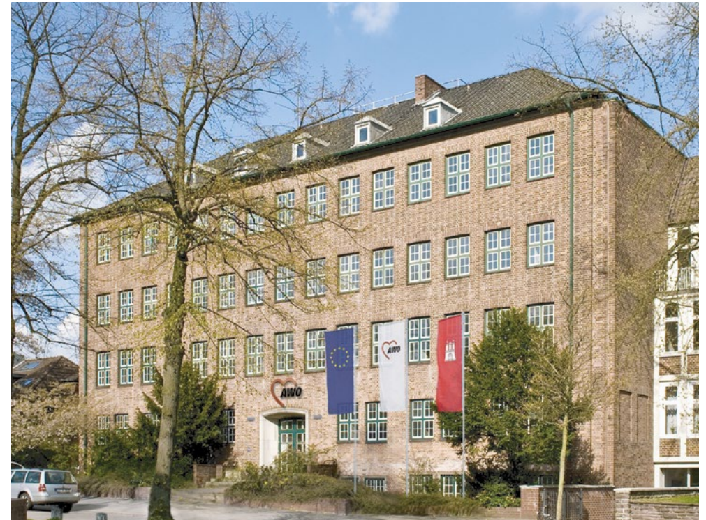
Das alte Polizeikrankenhaus – modernisiert dient es heute der AWO Hamburg als Hauptsitz.

Heute nutzt die AWO Hamburg das Bauwerk mit seiner charakteristischen Backsteinfassade als Verwaltungssitz. Durch ein modernes Raumkonzept konnten zusätzliche Flächen gewonnen werden, so dass sich alle Abteilung unter einem Dach befinden.