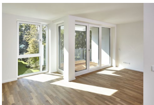
Blick in den Garten