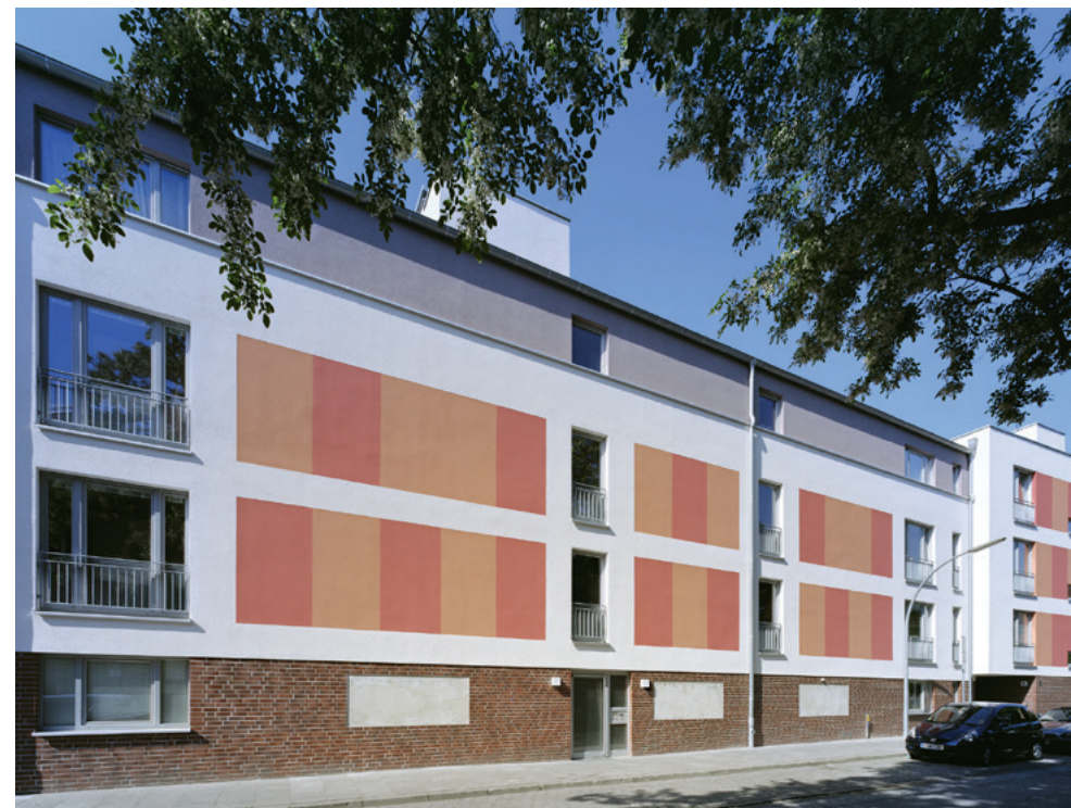
23 barrierefreie Apartments

Die Wohnanlage ist nach modernen Grundsätzen konzipiert und funktional-praktisch ausgestattet. Das Gebäude erfüllt den Energiestandard nach KfW 60, was durch eine hohe Wärmedämmung, den Einsatz von Solarthermie zur Brauchwassererwärmung und einer kontrollierten Wohnraumlüftung erreicht wird.