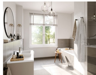
Moderne Bäder: ein Ambiente zum Verlieben