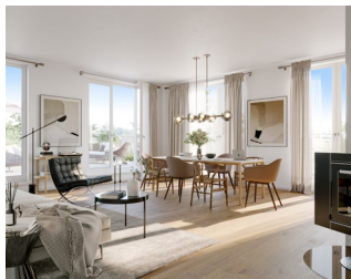
Platz für Gemütlichkeit: Räume voller Licht