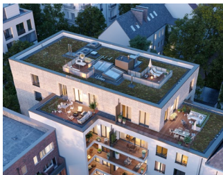
Die Dachterrasse: Eimsbüttel zu Füßen