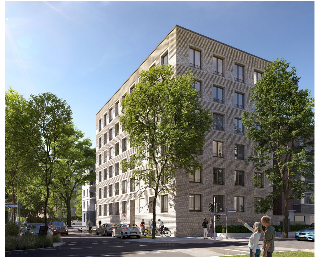
Die moderne Architektur des I'MSBÜTTEL setzt ein neues Highlight am Anfang der Osterstraße.

Mittendrin im Viertel, am Anfang der Flaniermeile Osterstraße gelegen, bringt das Ensemble dieses Lebensgefühl auf den Punkt. I'MSBÜTTEL ist ein modernes und urbanes Mehrfamilienhaus mit sechs Geschossen. Die 31 Wohnungen haben eine Bandbreite von 1 bis 4 Zimmern, davon 2 Penthouses. Details wie der Gemeinschaftsraum oder der Fahrstuhl bis in den obersten Stock stehen für außerordentlichen Komfort. Genauso wie die 20 Tiefgaragenstellplätze, die Schluss mit Parkplatzsuche machen. Balkon, Terrasse oder Loggia machen Sommertage zum Vergnügen. Und unterstreichen das Wohngefühl in diesem Ensemble. Denn wer hier wohnt, genießt das Leben.