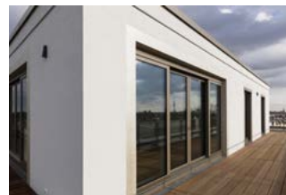
Penthouse mit Dachterrasse