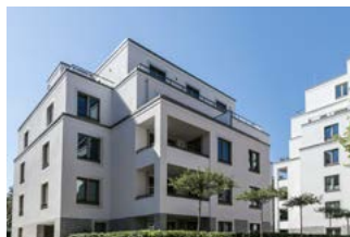
Moderne, elegante Architektur

Die drei 5 – 8-geschossigen Wohngebäude umfassen 67 Eigentumswohnungen von ca. 50 bis 200 m 2 . Die zeitlose, in sich stimmige Architektur berücksichtigt dabei das historische Umfeld und fügt sich hervorragend in die Umgebung ein. So bietet sich den Bewohnern täglich eine exklusive Alternative: Die Idylle im Hof oder das muntere Treiben im Quartier mit seinen zahlreichen Angeboten.