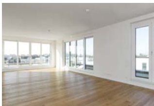
Großzügige, helle Räume