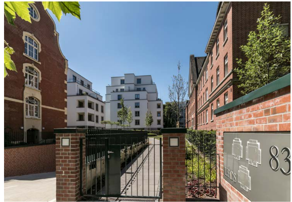
Historische Stiftsbauten und modernes Wohnensemble in harmonischer Kombination