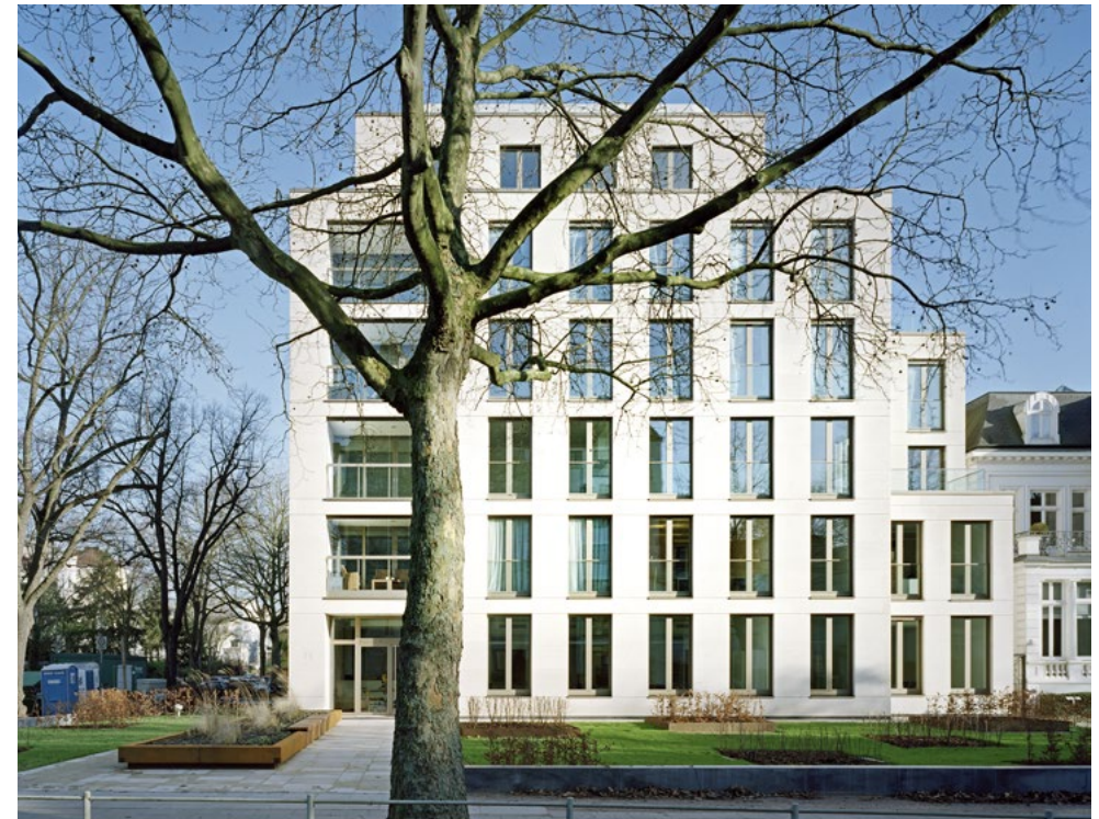
Traumhaft wohnen mitten in Rotherbaum.