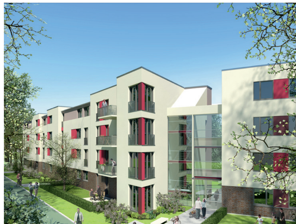
Das Generationenprojekt in Poppenbüttel.