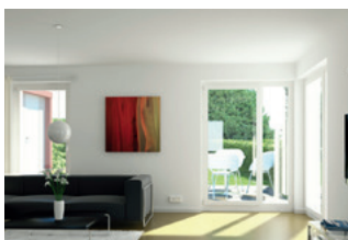
Hell und freundlich